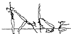
Apoio facial invertido, rolamento à frente (20%)

Construa uma sequência, com as diversas figuras, de forma a obter no mínimo 60 % de média do valor global dos elementos técnicos.